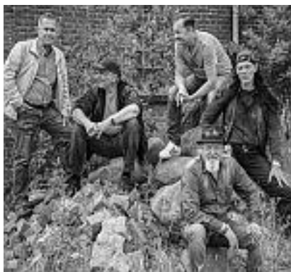
Too Mutz Blues Band - Since I've been loving you (Led Zeppelin Cover).