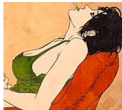
Alacran — Reflejo de Luna.