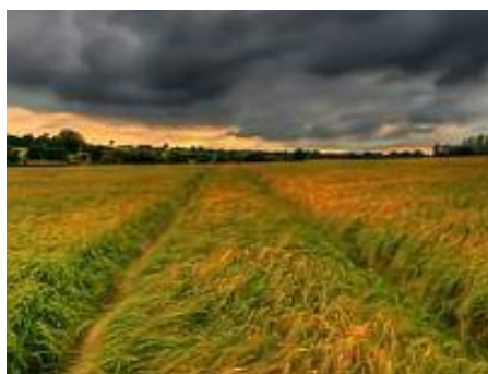
Aleksandr Borodin (1833-1887) met een stuk uit zijn opera Prins Igor.