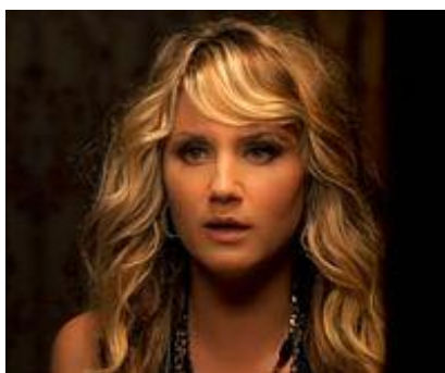
Sugarland - Keep You.